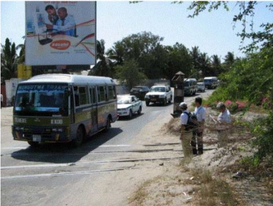
現在の対象道路（ゲレザニ道路）は片側一車線で、交通渋滞が慢性化している。