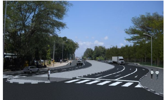
ゲレザニ道路 完成予想図