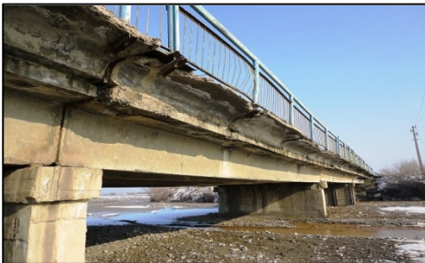
(損傷・老朽化が著しい橋梁)