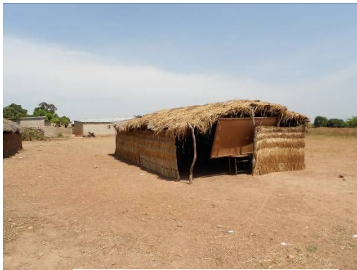
仮設校舎 藁葺き教室