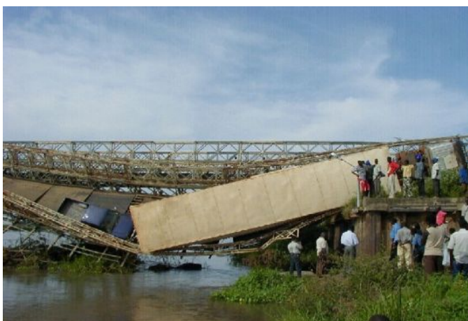
既存橋梁の落橋事故