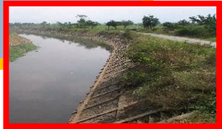
チタルム川上流支川流域 洪水対策セクターローン