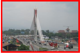
バンドン市内有料道路計画