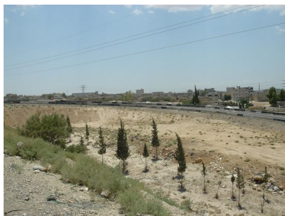
街灯設置対象位置であるジバブ地区の道路状況（左側中央分離帯に設置予定）