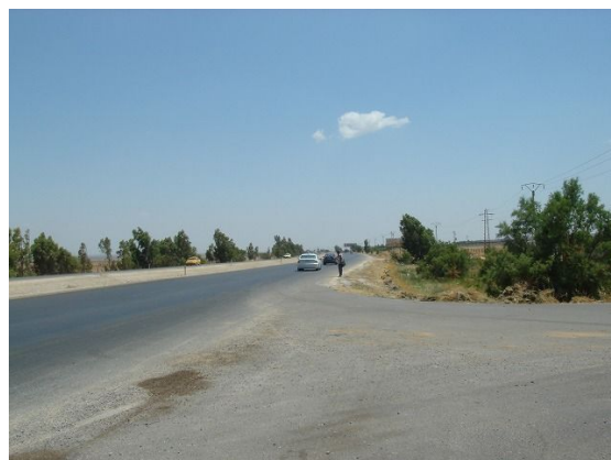
街灯設置対象位置であるジバブ地区の道路状況（左側中央分離帯に設置予定）