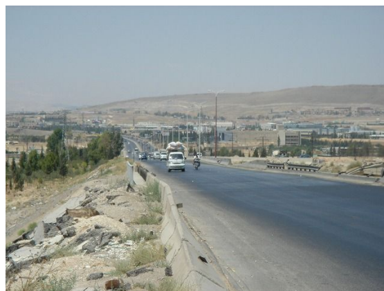
対象道路、ダマスカス方面からの 6 車線区間終了地点（6 車線区間には街灯設置済み）