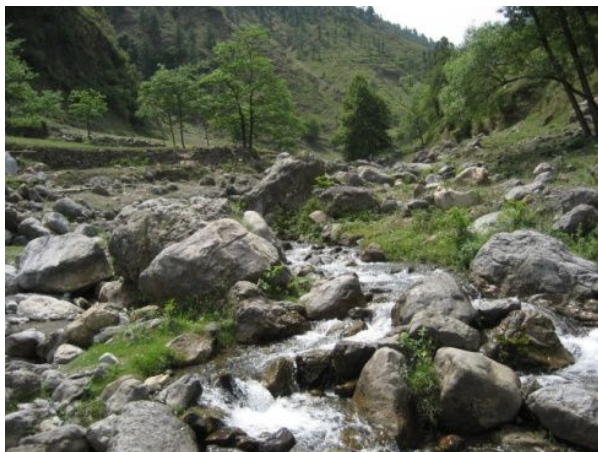
溪流からの取水施設の設置位置