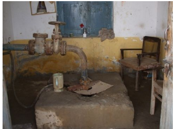
更新予定の既存井戸