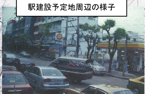
駅建設予定地周辺の様子