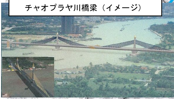
ノンタブリ1道路 チャオプラヤ川桥梁 (イメージ)