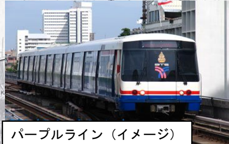
パープルライン (イメージ)