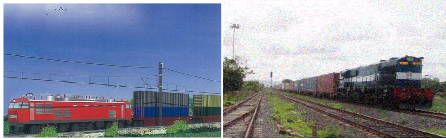
【完成予想図 (高性能電気機関車により2階建コンテナ貨車を牽引)】 【ムンバイ (JNPT 港) 付近の在来線の様子】