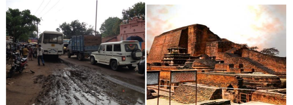
【都市 (Rajgir) 付近の様子】