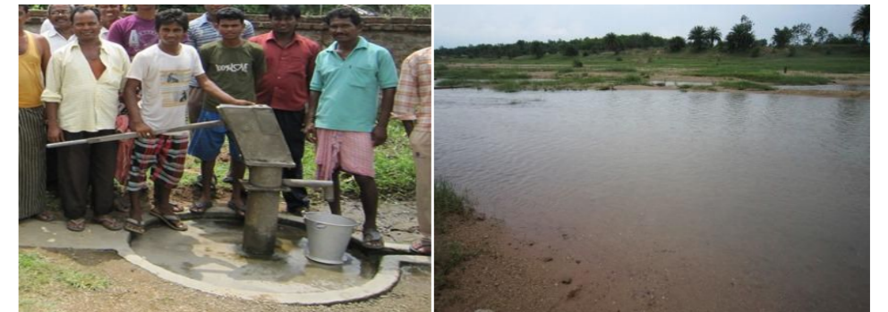
【現在使用されている井戸の様子】