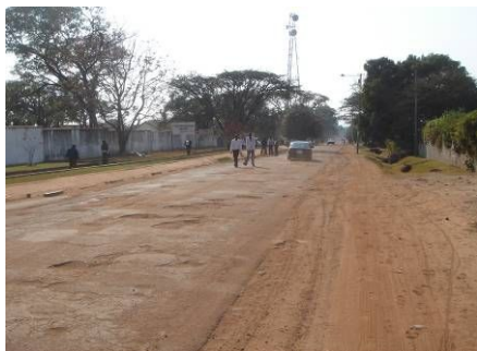
現在の対象道路状況