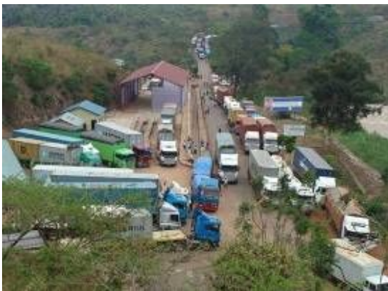
現在のルスモ国境（ルワンダ側）。十分な設備、駐車スペースがなく大型車で渋滞しており、タンザニア側も同様。