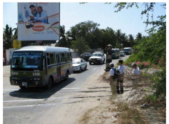
現在の対象道路（ゲレザニ道路）は片道一車線で、交通渋滞が慢性化している。