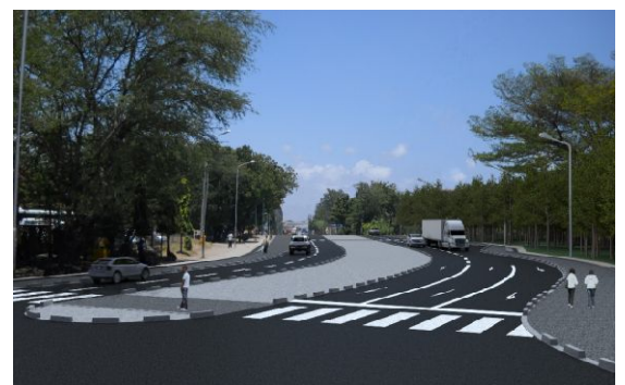
ゲレザニ道路 完成予想図