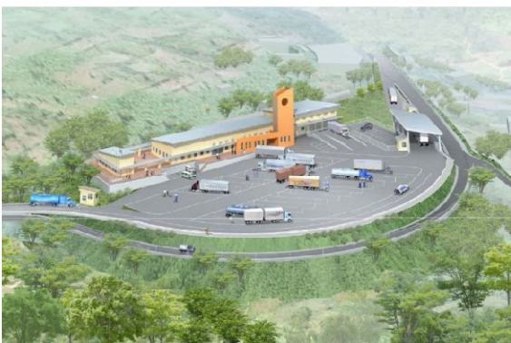
タンザニア側国境施設 完成予想図