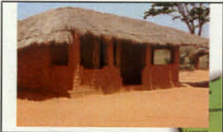
典型的既存小学校