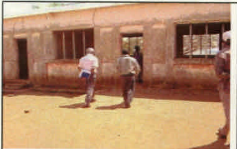
アルト・モロクエ: 修復予定のコミュニティ・センター