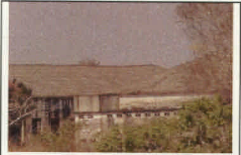
モナボ: 修復予定のコミュニティ・センター