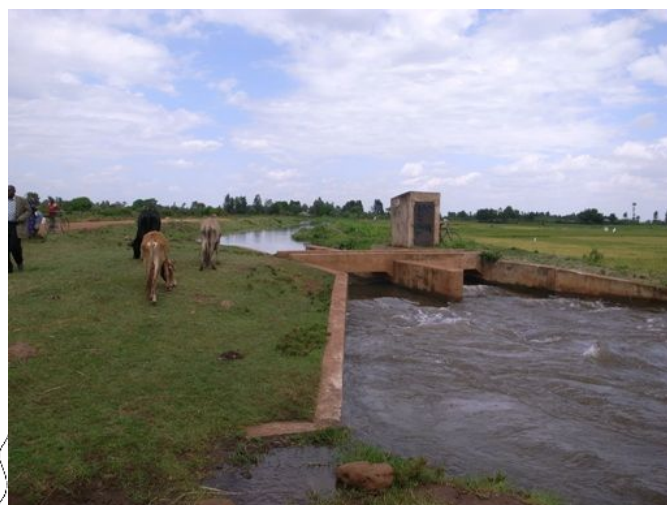
既存用水路（位置図②・③）