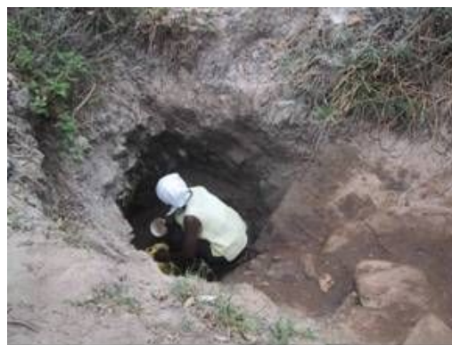
女性による水汲み労働の様子