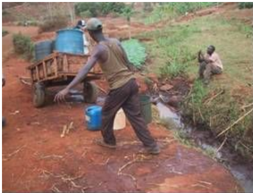
河川からの水汲みの状況