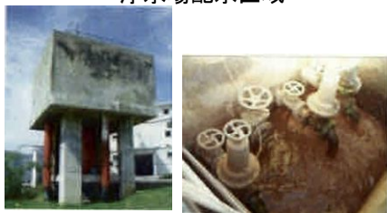
老朽化した施設の一部 (沈澱池 排泥弁)