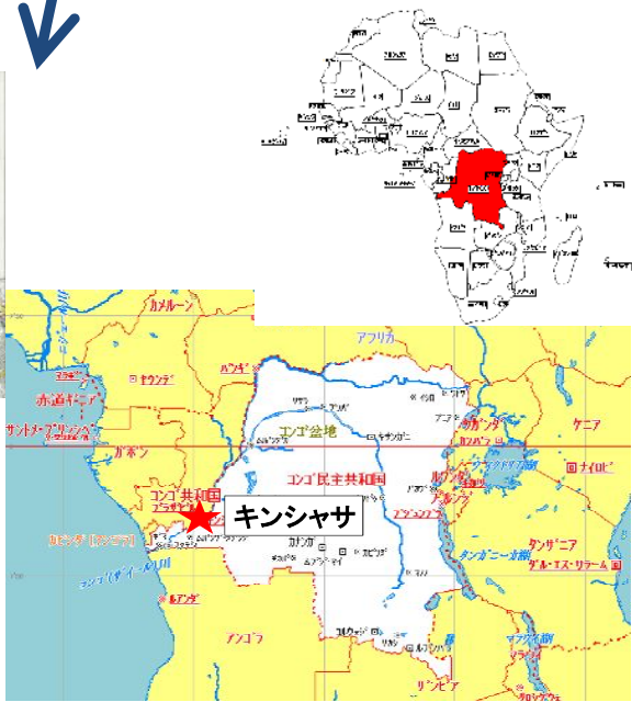
コンゴ民主共和国: 首都キンシャサ