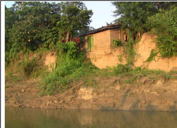
⑦ 波浪による侵食被害の状況。家のすぐ裏まで侵食されている。