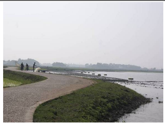
⑧ 乾季の始め頃の潜水堤防。左側が水田。