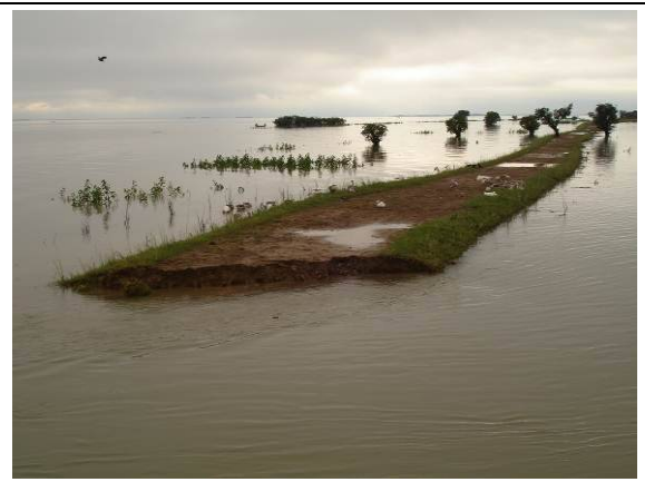
⑩ 雨季途中の潜水堤防。水位が上昇し、ほぼ水没している状況。一部越流により破損している。