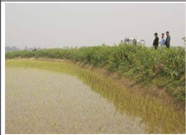
⑨ 乾季の潜水堤防。法面には、護岸のための植栽工が施されている。