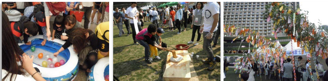
(左から)体験ブースの「ヨーヨー釣り」、「韓国式餅つき」、まほろば会の「七夕飾り」

「札幌市・大田広域市」、「仙台市・光州広域市」、「福島県」、「静岡県」、「静岡市」、「藤枝市・京畿道楊州市」、「鳥取県」、「岡山県」、「九州観光推進機構」、「JNTO」、「まほろば会七夕飾り」、「KJSFF」、「東亜大塚」、「日韓文化体験ブース」など。