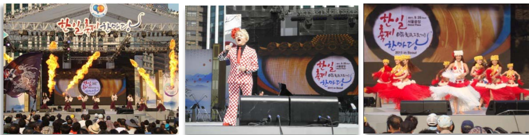
(左から)おまつりの舞台風景、「米良美一」氏、「福島のフラガール」

【出演団体等】「米良美一」、「フィジン」、「太鼓坊主」、「仙台すずめ踊り」、「福島のフラガール」、「躍動」、「はなこりあ」、「青森チアリーダー」、「打楽器研究所」、「ドラムキヤット」、「よさこいアリラン」、「秋田竿灯まつり」、「平澤農楽」、「ねぶた祭り」、「カンガンスルレ」など。