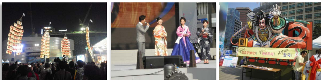
おまつりを盛り上げてくれた「秋田竿灯まつり」、「ミス日本ミス着物とミス 코리아ジャパン」、「ねぶた祭り」(左から)

最後に、出演して下さったたくさんの団体・個人の方々、大学生を中心とするボランティアの人たち、運営委員会の有志、協賛して下さった各企業、各方面の関係各位そして来場して頂き盛り上げて下さった観客の方々の皆様に対しまして「日韓交流おまつり 2011 in Seoul」運営委員会幹事として感謝申し上げます。