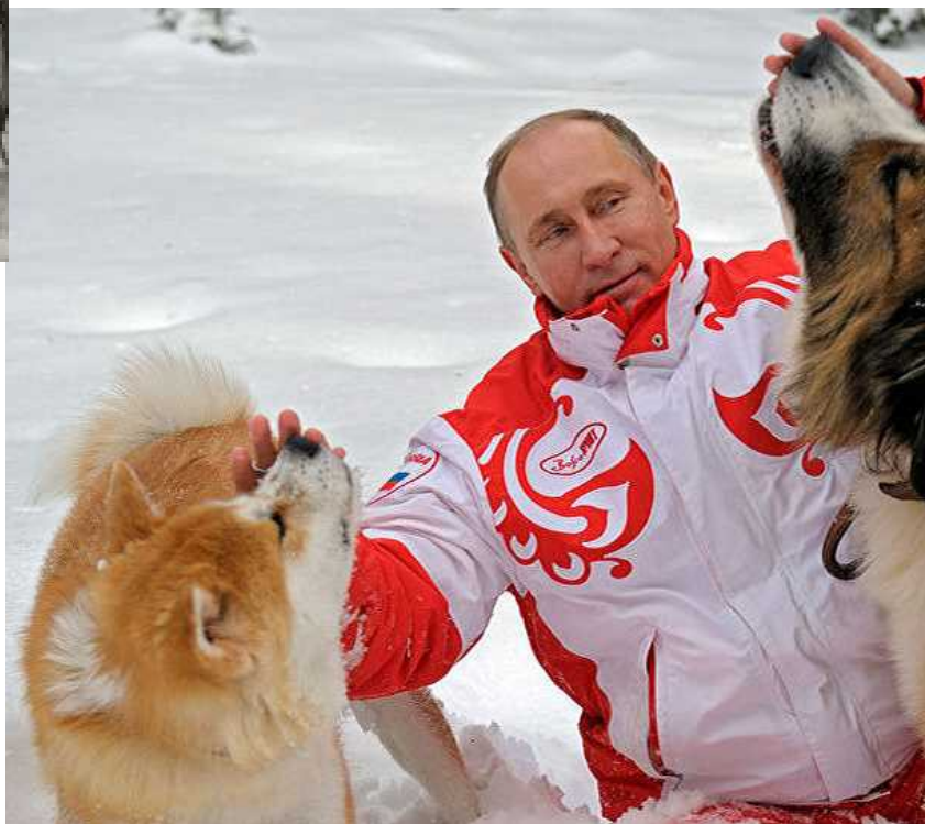
President Vladimir Putin & Yume