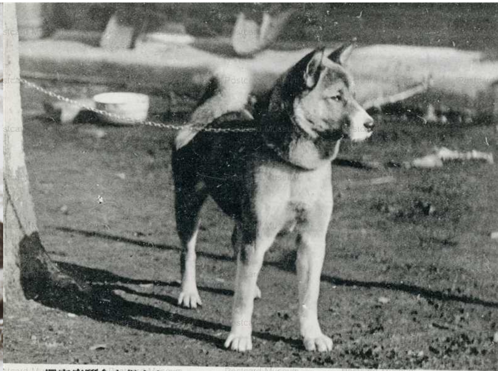
撰室究研會存保犬本日