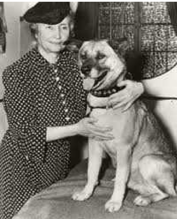
Helen Keller & Kenzan