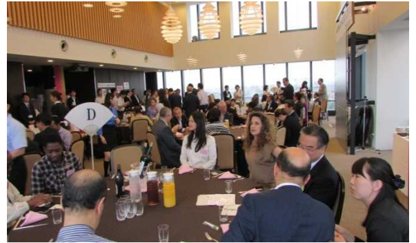
聖徳大学にて歓迎昼食会