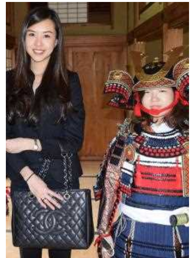
戸定が丘歴史公園にて甲冑隊と記念撮影