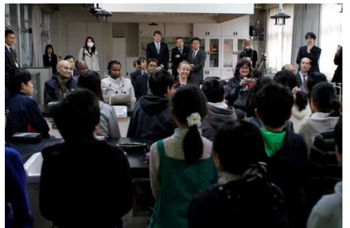
精華町立東光小学校