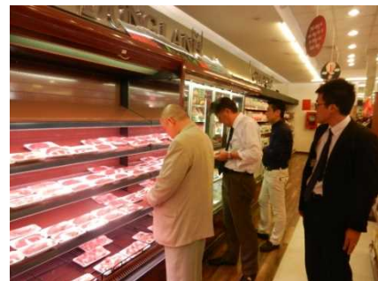
日本食材を扱うスーパーの視察 (ベトナム・ホーチミン)

プロモーションアドバイザーの助言を踏まえ、ベトナム・ホーチミンで現地バイヤー等との商談会を実施しました。今後も官民一体となって鳥取県産牛肉の販路開拓を進めていく予定です。