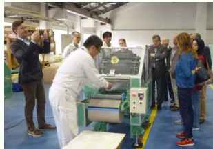
紙産業技術センターでの視察