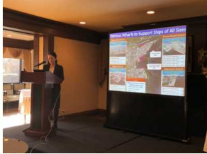
セミナーでのプレゼンテーション