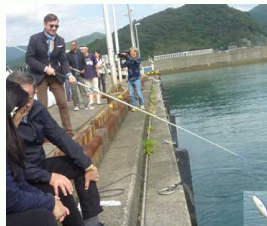
かつおの一本釣りに挑戦

10月25日及び26日の日程で、高知県と外務省との共催で、駐日各国大使の高知県視察を実施しました。津波・地震に備えた防災施設の視察や関連の意見交換を行ったほか、高知県が誇る紙産業や酒造など伝統産業の施設を視察しました。また、カツオの一本釣り漁法で有名な久礼漁港では、高知県での持続可能な漁業・水資源保護を目指す取組について説明を受けました。 詳細