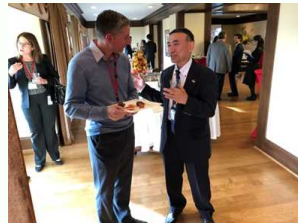
交流会での情報交換

10月24日、在シアトル総領事公邸において、日本海・瀬戸内海連携港主催の「ジャパン・クルーズセミナー in シアトル2018」が開催されました。同セミナーは、青森港、金沢港、境港、北九州港、広島港、神戸港の6港湾が連携して、米国のクルーズ船の寄港と外国人旅客の拡大を目指して実施されたものです。6港湾の代表者が、各々の港湾におけるクルーズ船の受入れ体制や、港湾背後にある観光資源の魅力に関するプレゼンテーションを行い、引き続き行われたレセプションでは、各港湾地元の地酒や名物料理が振る舞われました。 詳細