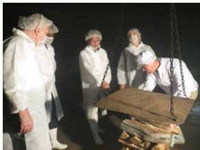
焼津の鯉節工場視察