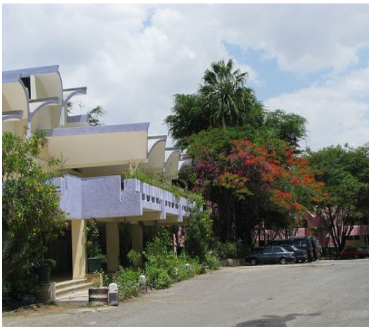
ソダレ温泉リゾート

現代のインフラ建設や既存のインフラの改善がここ数年でなされ街の様相が変わってきています。アダマには多くのスタンダードホテルやロッジがあり、首都アディスアベバに近いことから、多くの政府や国際機関、NGO 団体がミーティングを開くのに便利な場所です。そのことからアダマは会議観光の中心地となってきました。