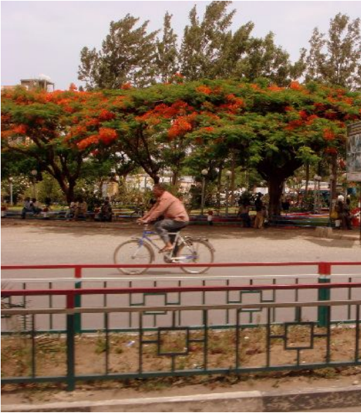
アダマの中心街にある道

アダマは会議、観光、ビジネスの中心地である近代都市になるよう努力をしています。街は国際協力や交流を増加するため姉妹関係を結べる日本の都市を探しています。よって、エチオピア連邦民主共和国大使館は、国際協力と交流を育む観点から関心のある日本の都市の皆様にアダマとのつながりを築ける可能性を考えて頂けるよう呼びかけています。