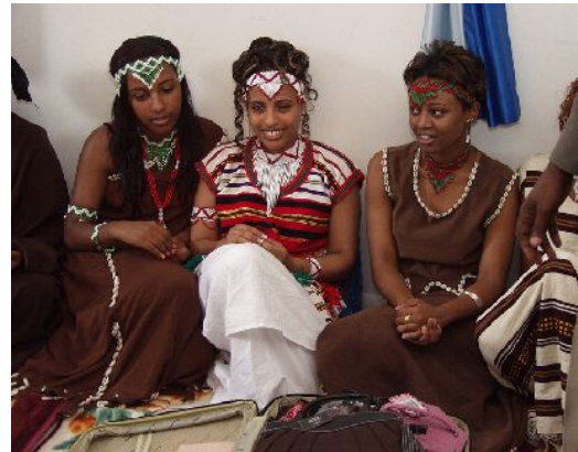
オロモの伝統衣装を身にまとうアダマの女性

アダマは海拔 1600-1700 m の標高を持ち、リフトバレー内に位置します。街は少しの夏雨と年中暖かい気温で過ごしやすい気候です。アダマはエチオピアの首都アディス・アベバから 100km 離れたところに位置する商業で活気あふれる街です。エチオピアとジブチ間を走る鉄道や幹線道路があり、アダマを通りジブチの港までつながっていることから 主要交通機関のハブとなっています。現在、アディスアベバとアダマ間の交通渋滞を軽減するため、この 2 都市間を結ぶ高速道路建設が進行しています。