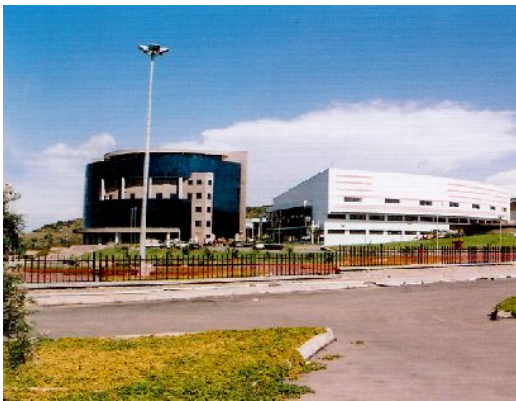
カフィー：オロミア州議会の本部

前回のグローバルでは城壁の街ハラールをご紹介しました。今回はエチオピアで最も多い民族オロモの人々が住むオロミア州にあるアダマ市をすこしご紹介します。