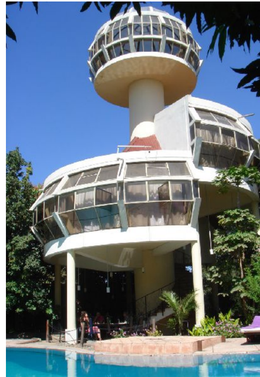
アダマにあるサファリロッジ

街の郊外にあるソダレ温泉リゾートも観光客に人気のスポットです。様々なレジャーが楽しめ、天然温泉もそのひとつです。アワシユ川岸の観光やリゾートホテルの敷地内に住む猿を見ることができます。アダマは、様々な野性生活、固有動物や植物、渓谷や滝のあるアワシユ国立公園が近くにあります。