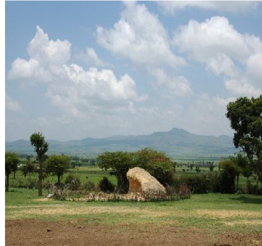
アダマ郊外の景観