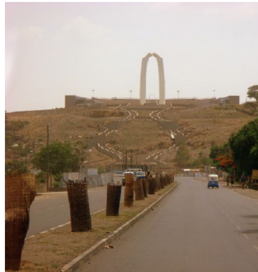
アダマの丘にある殉教者の像

大学は経済発展や大学—企業協力を重要視するエチオピアの規範大学になり、総合的研究教育拠点となることを目指しています。