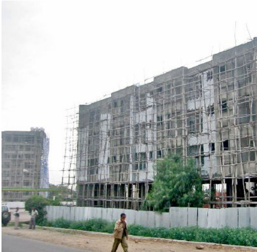
アダマの建設ブーム

現代のインフラ建設や既存のインフラの改善がここ数年でなされ街の様相が変わってきています。アダマには多くのスタンダードホテルやロッジがあり、首都アディスアベバに近いことから、多くの政府や国際機関、NGO 団体がミーティングを開くのに便利な場所です。そのことからアダマは会議観光の中心地となってきました。