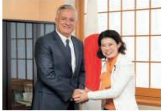
ジダン・モロッコ王国首相付投資・公共政策統合・評価担当特命相と会談する国光外務副大臣（10月30日、東京）

択され、同決議には、モロッコの自治提案が紛争解決の最も現実的な解決策であるとの言及が盛り込まれた。日本との関係では、10月に、ジダン投資相が訪日し、国光外務副大臣らと会談し、両国間の経済関係深化に向けた意見交換を行った。