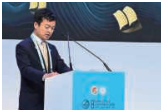
第8回インド洋会議2025に出席する宮路外務副大臣 (2月17日、オマーン・マスカット)

オマーンは、イランやホーシー派との独自のチャンネルをいかし、サウジアラビア・イラン間の外交関係正常化の交渉、サウジアラビア・ホーシー派間の交渉、米・イラン間の被拘束者交換の交渉・間接協議の仲介などを継続してき