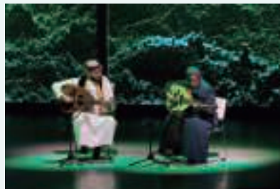
ナショナルデー公式式典 文化パフォーマンス：サウジタールーク（9月23日、大阪）

1932年に統一国家として成立したサウジアラビア。外交関係樹立70周年と重なり、大阪・関西万博でのナショナルデーはサウジアラビアの「今」を映し出し、同国との相互理解と交流促進に大きく貢献しました。くしくも、日本からバトンを引き継ぐ形で、2030年の万博はサウジアラビアの首都リヤドで開催されることが決定しています。このつながりがきっかけとなり、多くの日本人が2030年のリヤド万博を訪れ、日・サウジアラビアの相互理解が一層深まることで、次世代の交流促進につながっていくことを期待してやみません。