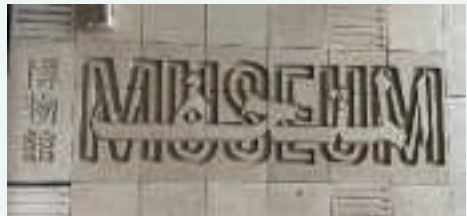
日本語も併記されている大エジプト博物館内部の表示