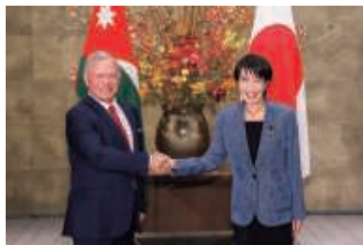
日・ヨルダン首脳ワーキング・ディナー (11月11日、東京)

2024年に、日・ヨルダン外交関係樹立70周年を迎え、両国の官民を含む様々なレベルでこれを記念する行事が開催された。2025年には、外相レベルでは、2月及び5月に岩屋外務大臣