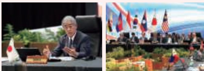
CEAPAD第4回閣僚級会合で共同議長を務める岩屋外務大臣（左）と会合の様子（右） （7月11日、マレーシア・クアラルンプール）

日本は、「包括的計画」の実施と将来の「二国家解決」に向けた取組の一環として、引き続きCEAPADを通じたパレスチナ支援の輪の拡大と連携の強化に努めていきます。