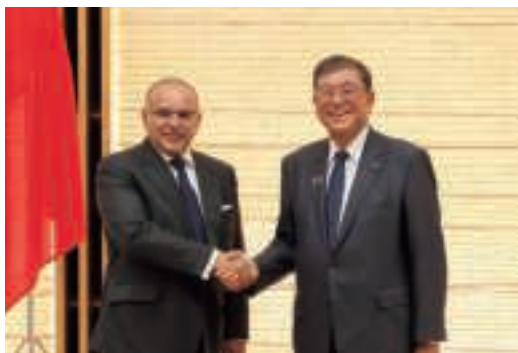
石破総理大臣とサルマン・バーレーン皇太子兼首相との会談 (9月19日、東京)

め米国・ニューヨークを訪問中の石破総理大臣が、サバーハ・ハーリド皇太子と会談を実施し、両国の緊密な関係を再確認した。