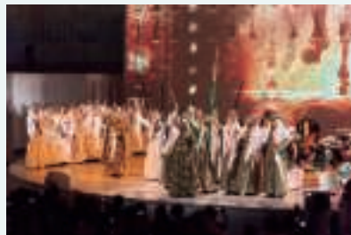
ナショナルデー公式式典 文化パフォーマンス：サウジ伝統舞踊「アルダ」（9月23日、大阪）