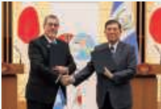
日・グアテマラ首脳会談（6月10日）

2025年日本国際博覧会（大阪・関西万博）の開催は、日本と中米諸国との関係を深める絶好の機会となりました。大阪・関西万博にはグアテマラ、ベリーズ、ドミニカ共和国、パナマ、ホンジュラス等が参加し、それぞれの豊かな自然や多彩な文化と歴史を紹介しました。また、万博のナショナルデー等の機会に合わせて、アレバロ・グアテマラ大統領、ムリーノ・パナマ大統領、ブリセーニョ・ベリーズ首相が訪日したほか、ホンジュラス、コスタリカ、ドミニカ共和国からも閣僚が訪日し、日本との関係を深めました。「交流年」における「万博外交」の展開は、日本と中米諸国との友好関係促進にも大きな役割を果たしました。