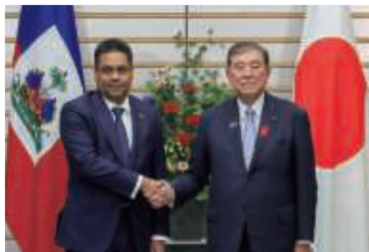
日・ハイチ首脳会談(10月9日、東京)

ハイチでは、2021年の大統領暗殺以降、行政及び立法が十分に機能しておらず、また、首都圏を中心に武装集団（ギャング）が勢力を拡大しており、治安が極度に悪化している。これを受け、2024年6月、ハイチ政府の要請に応じ、国連安全保障理事会（国連安保理）決議に基づく多国籍治安支援（MSS）ミッションが活動を開始した。さらに、2025年9月、国連安保理は同ミッションのギャング制圧部隊（GSF）への移行を承認した。日本としても、ハイチの安定化に向けて、治安、ガバナンス、人道分野を中心とした支援を実施している。