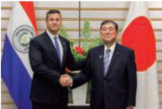
日・パラグアイ首脳会談 (5月21日、東京)

日本との関係では、5月にペニャ大統領が訪日し、石破総理大臣との間で首脳会談を実施した。両首脳は、日・パラグアイ政策協議の立ち上げ及びパラグアイの一般旅券所持者に対する短期滞在査証免除措置に係る文書の署名・交換式に立ち会うとともに、両国関係を「戦略的パートナー」と位置付け、日・パラグアイ投資協定の実質合意を発表した。また、大統領に同行して訪日したラミレス外相と岩屋外務大臣の間で外相会談が行われ、両者は、二国間関係をより強化していくことで一致した。