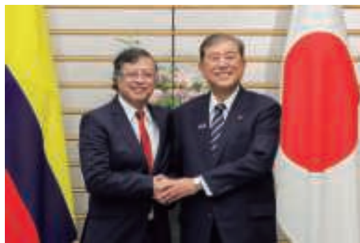
日・コロンビア首脳会談 (9月4日、東京)