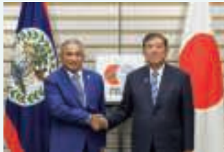
日・ベリーズ首脳会談（8月4日）