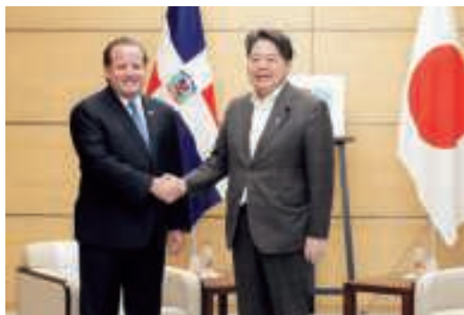
パリサ・ドミニカ共和国大統領府相による林官房長官表敬 (8月20日、東京)

の機会に、パリサ大統領府相が訪日し、林芳正官房長官への表敬を行ったほか、東京において日本企業向けに投資促進セミナー等が開催された。