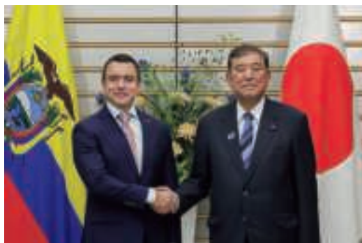
日・エクアドル首脳会談 (8月28日、東京)