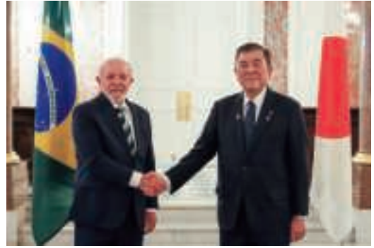
ルーラ・ブラジル大統領を出迎える石破総理大臣 (3月26日、東京)

ルーラ政権は、社会保障の強化や税制改革に取り組むとともに、積極的に対外政策を進めている。また、環境・気候変動対策を重要な政策課題として掲げ、11月には国連気候変動枠組条約第30回締約国会議（COP30）をバレン