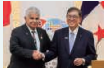
日・パナマ首脳会談（9月5日）