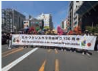
第40回浅草サンバカーニバルパレードコンテストに両国外交官も参加(8月30日、東京・浅草)