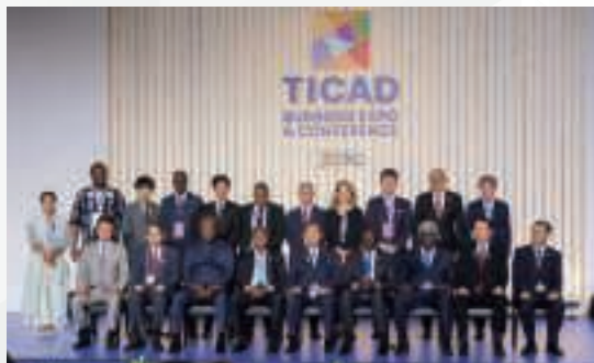
▲ 協力文書披露式典の様子 (8月21日、横浜)

2013年のTICAD Vで、「援助から民間投資へ」という考えが打ち出されて以降、日本企業のアフリカへの関心はますます増してきています。今回のTICAD 9ではTICAD 8の3倍超となる324件のビジネス関連の協力文書が結ばれ