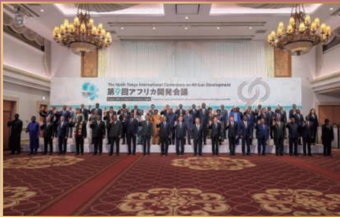
▲ TICAD 9参加首脳による写真撮影（8月20日、横浜）

TICAD（アフリカ開発会議：Tokyo International Conference on African Development）は、1993年に日本が立ち上げた、アフリカ開発に関する国際会議です。アフリカの「オーナーシップ」と、日本を含む国際社会との「パートナーシップ」という基本理念の下で、アフリカの開発を支援しています。