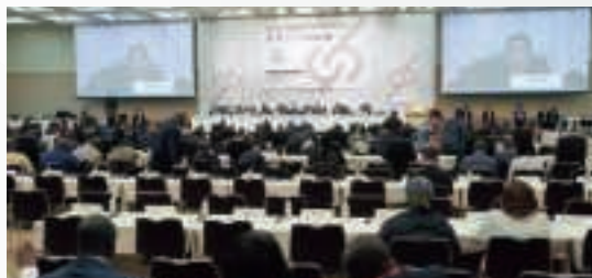
▲ 全体会合における議論の様子（画面は議長代理を務める岸田元総理大臣）（8月21日、横浜）