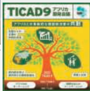
▲ TICAD 9のテーマ及び重点事項