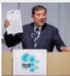
▲ 閉会式で成果文書を採択する石破総理大臣（8月22日、横浜 ）

3日間の議論の成果は、首脳宣言である「TICAD 9横浜宣言」にまとめられ、最終日に採択されました。会議終了後に開かれた共同記者会見で、石破総理大臣から、今後もTICADの原点を生かしながら、TICADを絶えず良いものに発展させるため取り組んでいくことを表明しました。