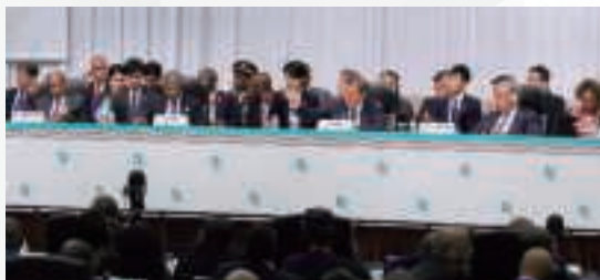
▲ 開会式でロウレンソ・アンゴラ大統領と共同議長を務める石破総理大臣（8月20日、横浜）

TICAD 9では、「革新的な課題解決策の共創」をテーマとして議論が行われました。