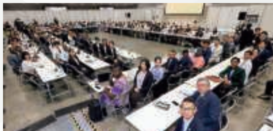
▲ 模擬アフリカ連合会議の様子 (8月20日、横浜)