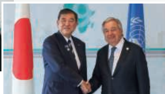
▲ 石破総理大臣とグテーレス国連事務総長との会談（8月20日、横浜）