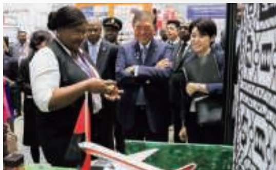
▲ 「TICAD Business Expo & Conference」の企業ブースを視察する石破総理大臣 (8月21日、横浜)

ました。また、テーマ別イベントとして独立行政法人日本貿易振興機構（JETRO）が主催したTICAD Business Expo & Conference には過去最多の194企業・団体が出展し、日・アフリカ双方の企業関係者等約1万人が参加しました。