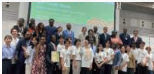
▲ Youth Forumの様子 (8月20日、横浜)

さらに、模擬国連に倣った模擬アフリカ連合会議も実施され、日本とアフリカの学生・若者がチームを組み、AU加盟国代表を模して経済、政治、科学・技術をテーマに意見を述べ合い、三つの総会決議を採択しました。