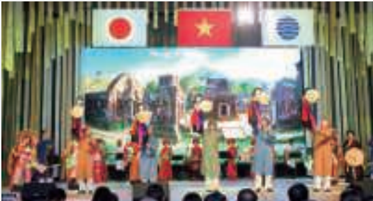
▲ ベトナム・ナショナルデーの様子 (9月9日、大阪)

外務副大臣や外務大臣政務官等外務省幹部は日々、公式式典及び公式催事（文化プログラム）、午餐会や晚餐会に出席し、日本館や各国パビリオン視察に同行しました。公式式典及び公式催事などでは、各国・地域及び国際機関の公式参加者のほか、一般の来場者とも交流を深めることができました。また、各国・地域のナショナルデーには、各パビリオンが独自のイベントを開催することも多く、これら行事を通じ、日本と世界中の方々と間に友情や信頼を育むことができました。