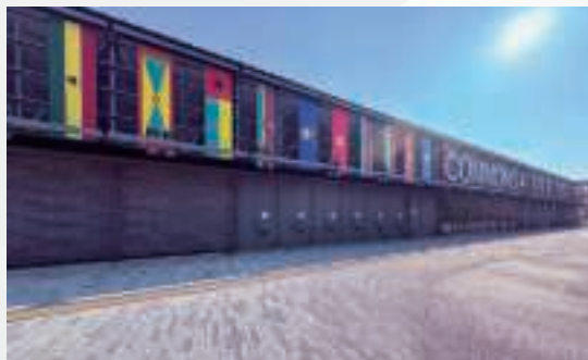
▲ コモンズAの外観(大阪)