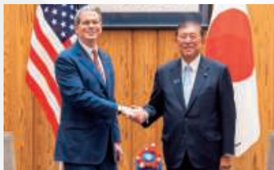
▲ベッセント米国財務長官等大統領代表団による石破総理大臣への表敬 (7月18日、東京)