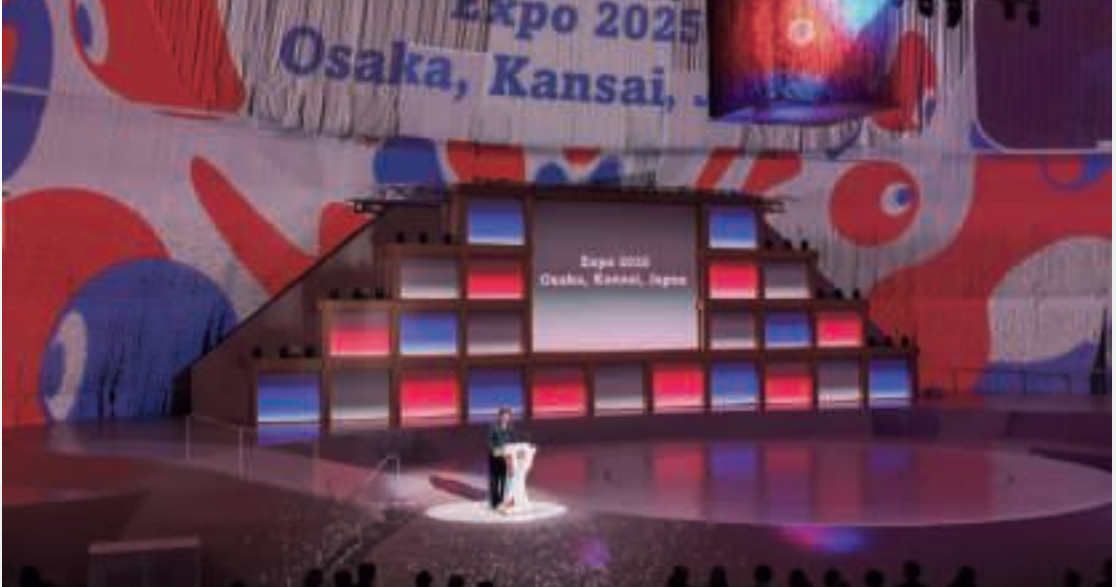
▲ 開会式の様子 (4月12日、大阪)

「いのち輝く未来社会のデザイン」をテーマに、2025年日本国際博覧会（大阪・関西万博）が4月13日から10月13日までの184日間、大阪府大阪市夢洲 しほ で開催されました。