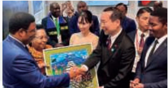
▲ タンザニア・ナショナルデーにおける、マジリワ首相と藤井比早之外務副大臣によるタンザニアパビリオン視察(5月25日、大阪)