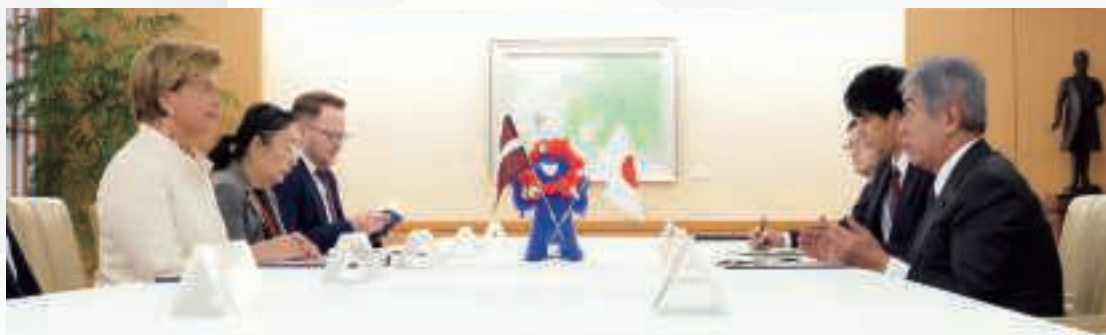
▲日・ラトビア外相会談 (9月18日、東京)