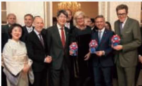
▲ 在オーストリア日本国大使館における大阪・関西万博レセプション (3月24日、在オーストリア日本国大使館)