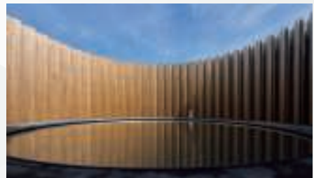
▲ ごみから生まれた水をたたえた日本館の「水盤」 (大阪)

そのほか、万博会場内で開催された、SDGsシンポジウム「OSAKA JAPAN SDGs Forum」*2の冒頭において、岩屋外務大臣がビデオ・メッセージを寄せ、万博が、SDGsのベースとなる知見を国際社会と共有する知的交流の場であることを強調しました。