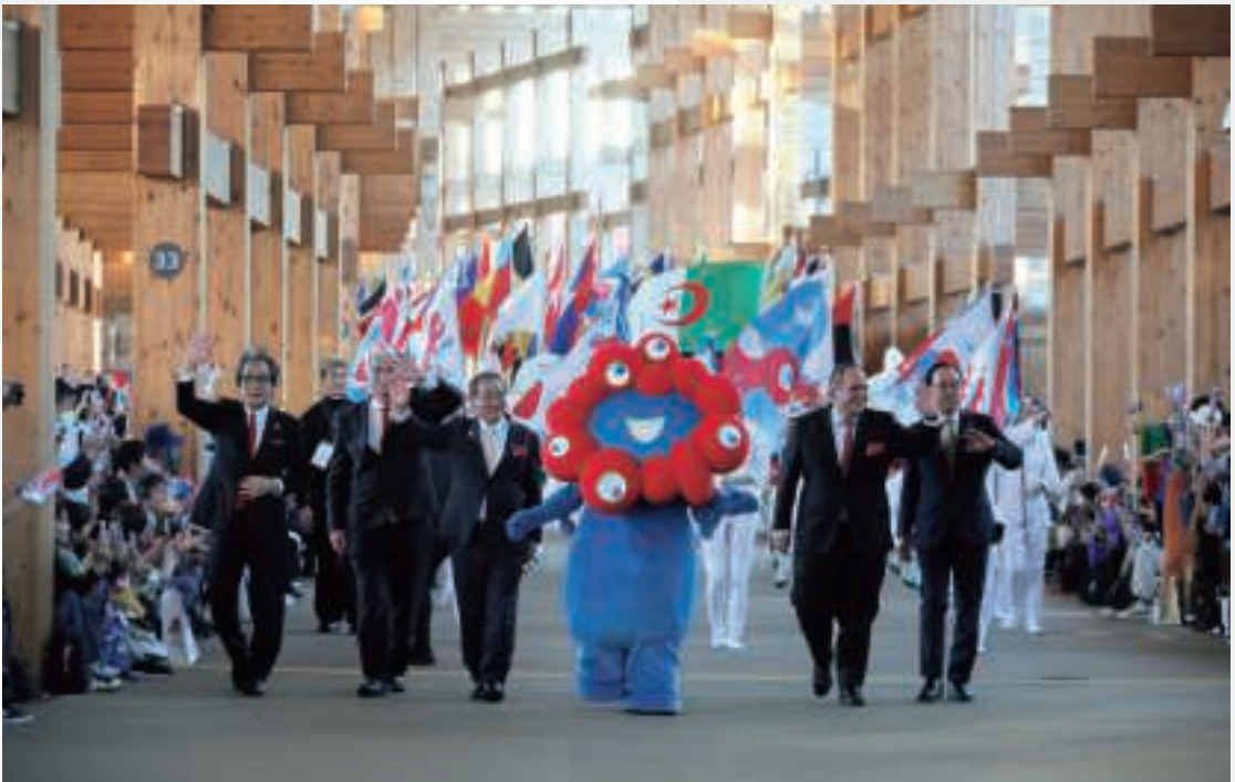
▲最終日のフラッグパレード(10月13日、大阪)

大阪・関西万博では、関わったすべての人々が、多様でありながらも、ひとつにつながり、対話し、共働し、それぞれの文化を共鳴させ合う中で、いのち輝く未来社会に向けたメッセージを発信してきた。そうした議論や実践が、今後の万博に継承されるとともに世界の人々が未来社会をデザインしていくことに資することを願い、本宣言とする。