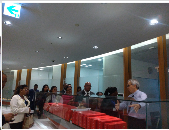
10月28日【視察】川崎汽船（株）