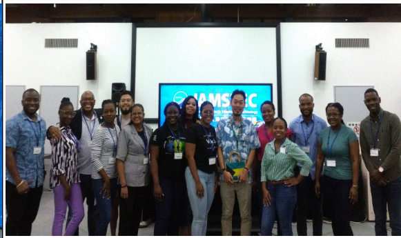
10月26日【講義・視察】国際海洋環境情報センター