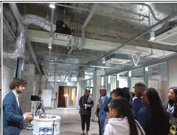
10月29日【講義】WOTA株式会社