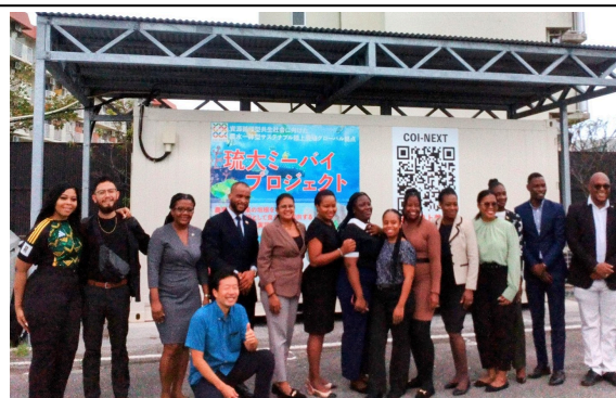
10月25日【視察】琉球大学