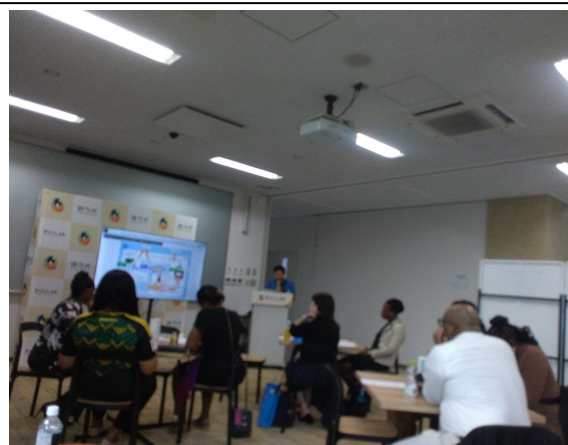
10月25日【講義】琉球大学