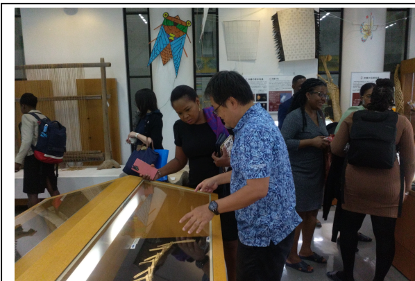
10月25日【講義】琉球大学 風樹館（博物館）