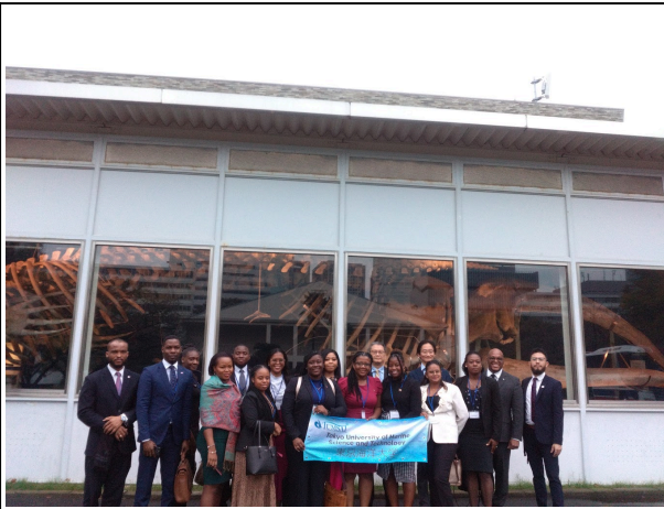
10月28日【視察】東京海洋大学