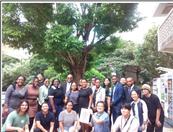
10月25日【視察/交流】琉球大学(講義)