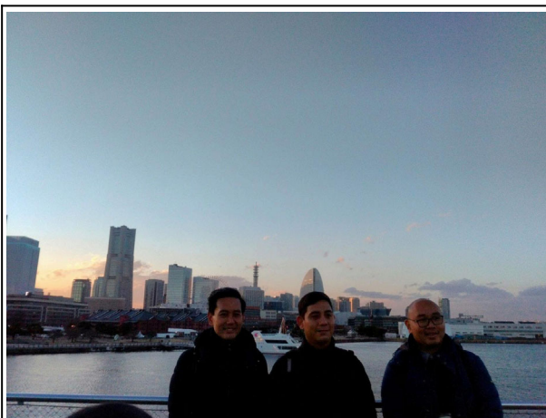
1月28日【視察】横浜港内大栈橋