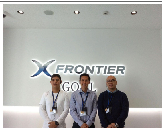
1月29日【視察】佐川急便Xフロンティア