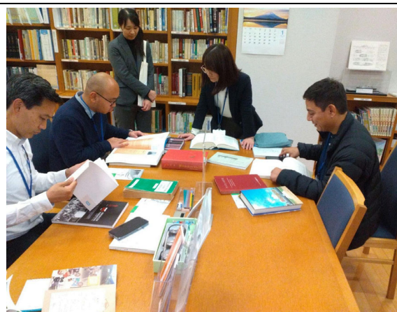
1月28日【視察】JICA横浜海外移住資料館