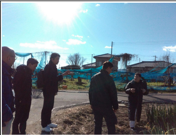
1月30日【講義・視察】株式会社ティーエスファーム