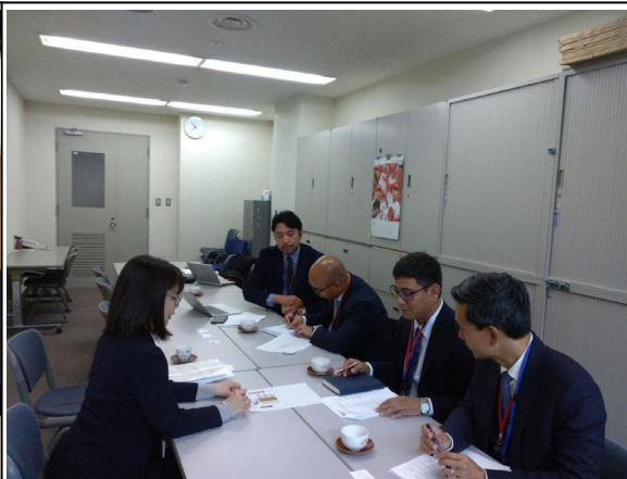
1月27日【来日後オリエンテーション】