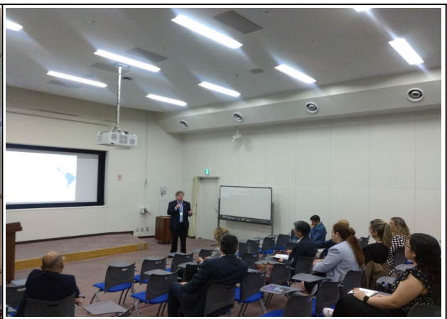
10月4日【報告会】プレゼンテーションの様子