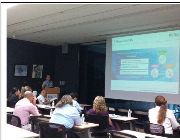
10月1日【テーマ関連講義・視察】国際総合 睡眠医科学研究機構 施設見学