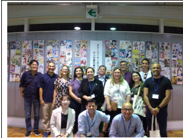
10月2日【テーマ関連講義・視察】精華大学