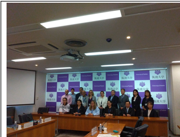
10月1日【テーマ関連講義・視察】筑波大学 表敬訪問