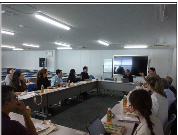
10月2日【テーマ関連講義・視察】精華大学