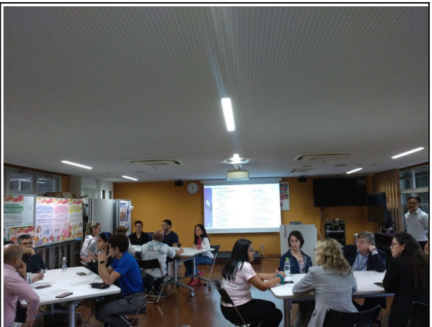
10月2日【テーマ関連講義・視察】筑波大学大 南米スペイン語圏留学生との懇談