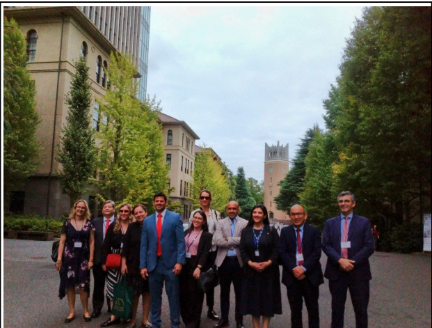
9月30日【テーマ関連講義・視察】早稲田大学