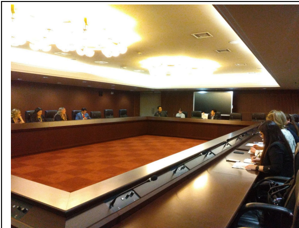
9月30日【テーマ関連講義】外務省