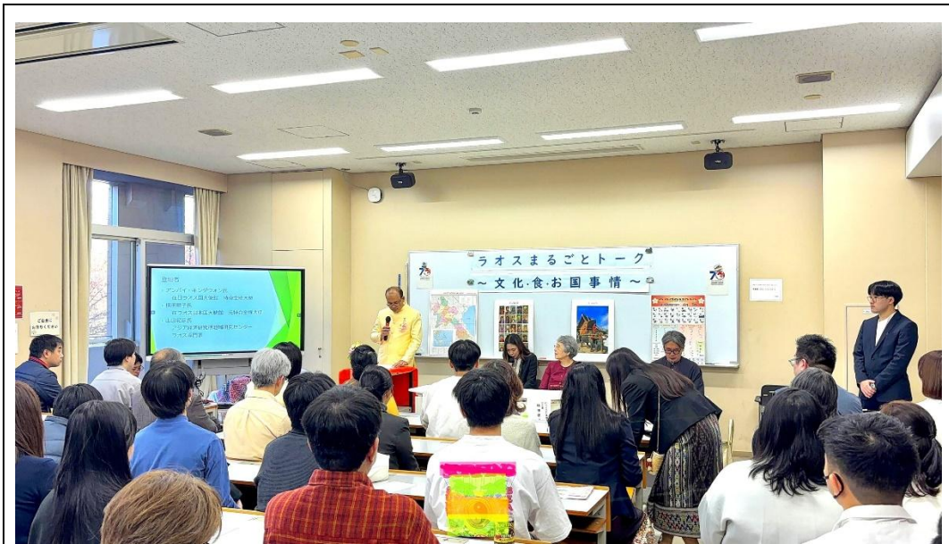
トークショーの様子