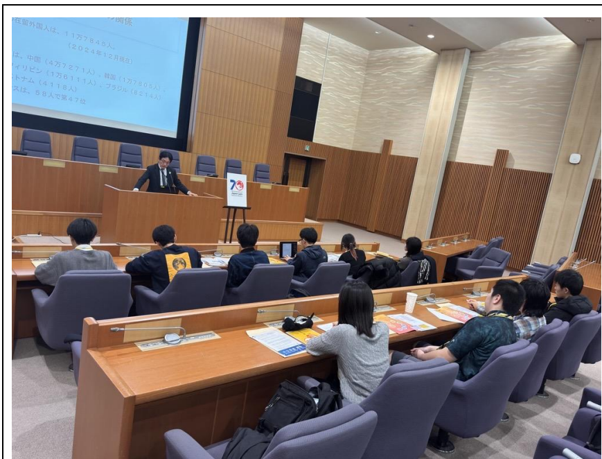
外務省訪問の様子

12月3日、自由の森学園高等学校(埼玉県)の生徒が外務省を訪問しました。ラオス語専門職員が登壇し、外務省の業務や日ラオス外交関係樹立70周年等について紹介や質疑応答が行われました。