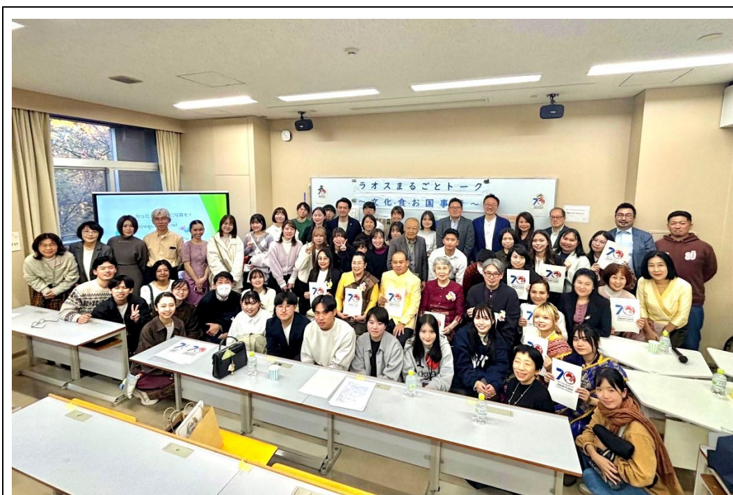
講演の様子 参加者とともに