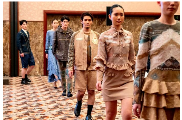
ラオスの布を使用して制作された 日本人デザイナーによる作品