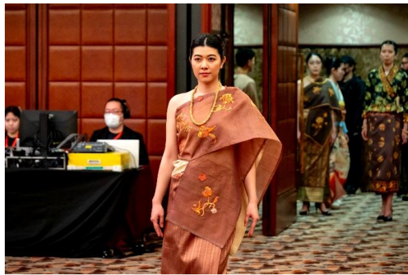
ラオス人デザイナーによる作品

Lao Fashion and Culture Festival in Tokyo 2026年3月31日 開催