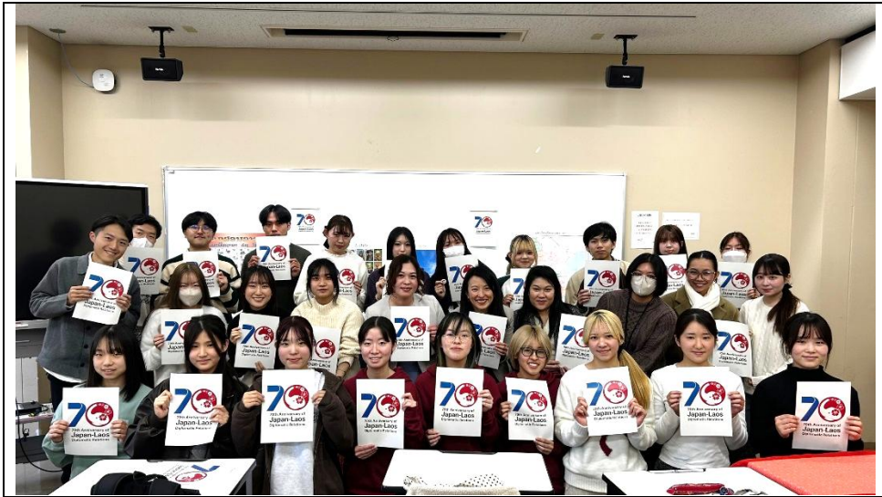
集合写真 日ラオス外交関係樹立70周年ロゴマークとともに