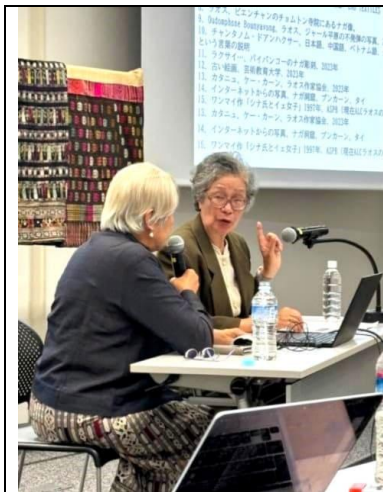
「ナーガ」について ご紹介する様子