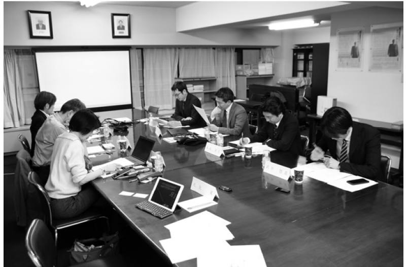
研究チームによる研究会合の様相

フードセーフティの分野からすると 2 つある。一つは、水産業における国際的な資源管理に関する点である。IUU (Illegal, Unreported and Unregulated) 漁業という違法・無報告・無規制で漁獲された海産物の流通を排除するために、漁獲証明に関する法整備が EU などで進められている。しかしながら、現時点では各国で求める証明内容が異なっており、こうしたなかで国際的な標準が取り決められることが望ましい。中国は海産物の消費大国であり、日中が協力して漁獲証明の国際基準の設定に向けた取り組みを進めることは意義があるだろう。