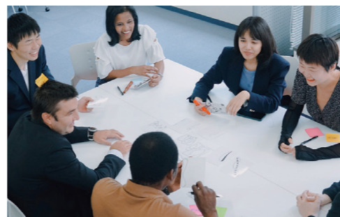
研修プログラム受講風景