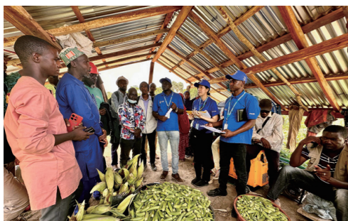
海外派遣での活動風景