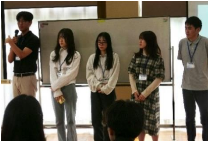
昨年の合宿の様子