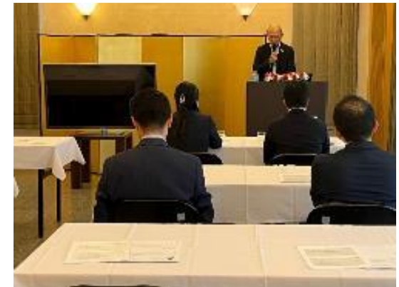
②法務セミナー（冒頭の大使挨拶）