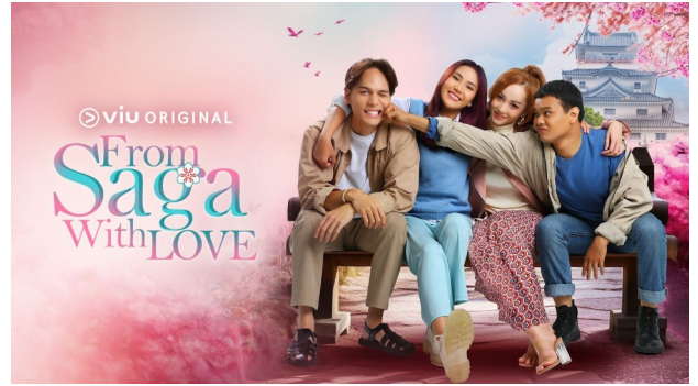
マレーシアドラマ「From Saga, With Love」