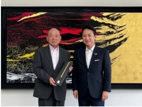
武内和久北九州市長表敬