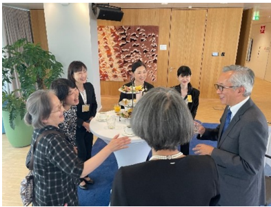
南足柄市関係者との交流