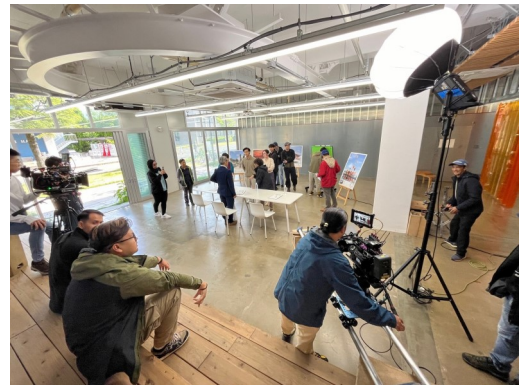
佐賀大学におけるドラマ撮影の様子