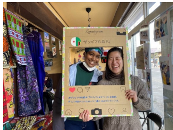
ザンビアフェスでの一幕