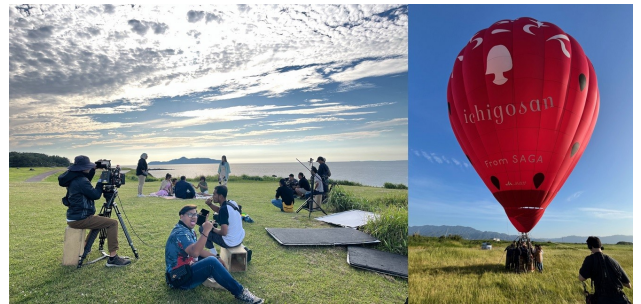
県内有数の観光地「波戸岬」での撮影シーンと「いちごさん」バルーン搭乗シーン