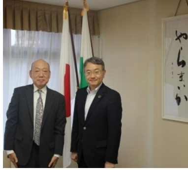
中野祐介浜松市長表敬