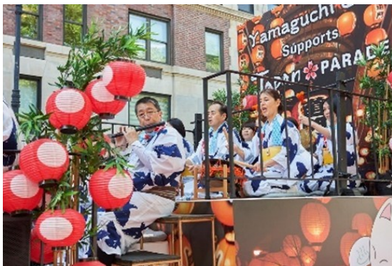
山口祇園囃子保存会による演奏