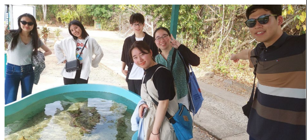
2/17 スミソニアン熱帯研究所視察