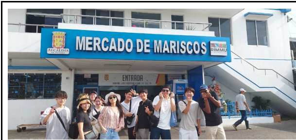
2/18 市場（マリスコス）視察