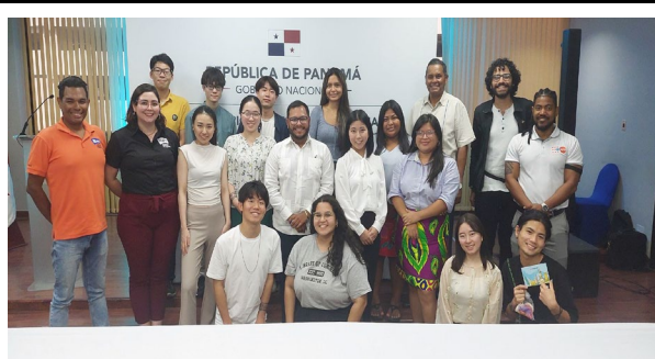
2/19 パナマ社会開発省表敬訪問