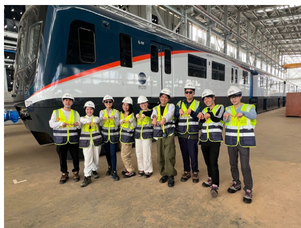
2/21 首都圏都市交通 3 号線事業視察