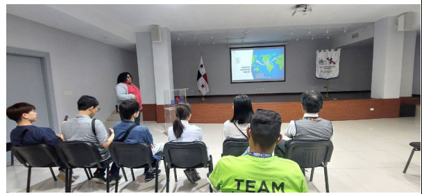
2/16 コロン・フリーゾーン視察