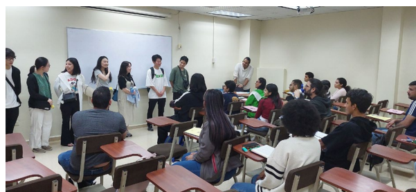
2/17 パナマ工科大学日本語学専攻学生との交流