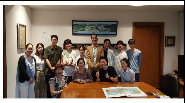
パナマニッポン・トレード社 ヨシモト社長 講義