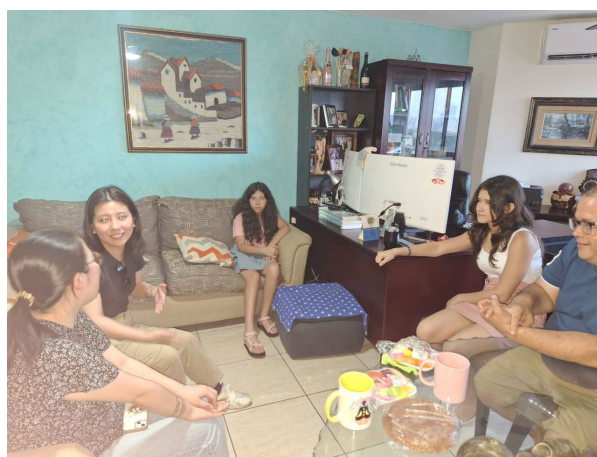
2/18 ホストファミリーとの交流