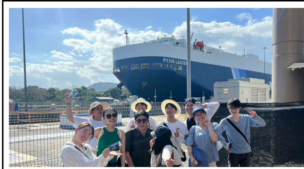
ミラーフローレス水門ビジターセンター視察