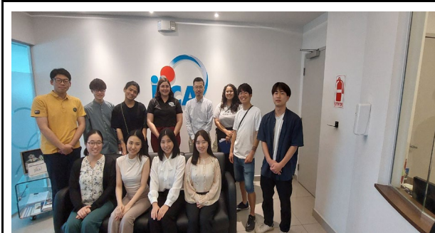
2/19 JICA 講義