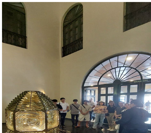
2/18 パナマ歴史美術館視察