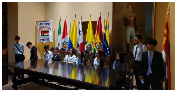
2/21 パナマ国外務省表敬訪問