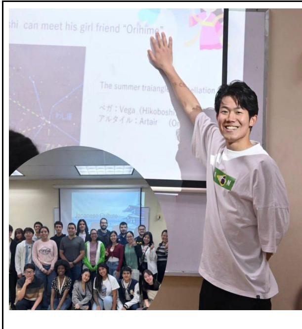
2/17 (Instagram:参加学生)パナマ国際海事大学