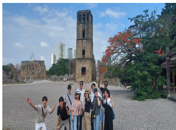
2/18 パナマ旧市街視察