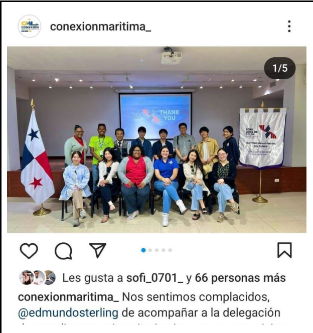
2/16 (Instagram : コロンフリーゾーン)