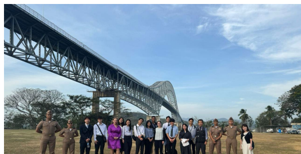
2/21 パナマ国際海事大学との交流