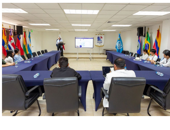
2/21 パナマ海事庁表敬訪問