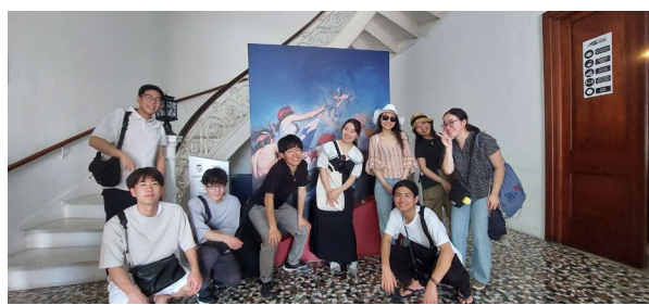
2/18 パナマ運河博物館視察