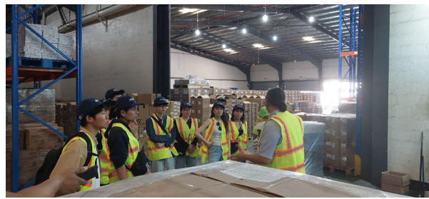
2/16 アイシングループ視察