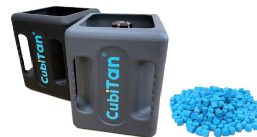
MOFを活用した次世代高圧ガス容器「CubiTan®」