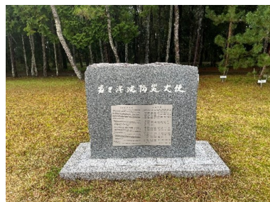
黒潮町「若き津波防災大使」記念碑、黒潮宣言。後方には記念植樹後7年余り育った木々