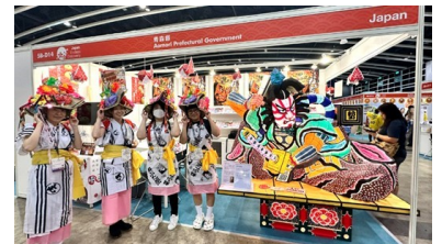
香港で実施されたイベントにおける発信の様子