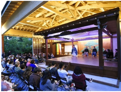
エクス=アン=プロヴァンス市に寄贈された総檜造りの能舞台