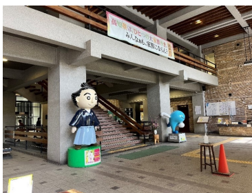
現在の高知県庁の1階ホールに掲げられた「高知家」キャンペーン