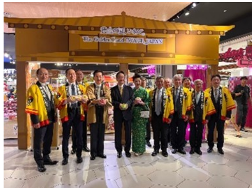
イオンマレーシアでの「いわてフェアPRセレモニー」

「世界の成長センター」として発展を続け、ASEAN諸国の中でも特に高い成長率を誇るマレーシアにおいて、岩手県はこれまで、2007年から2016年まで物産展を開催するなど、同国との経済交流を重ねてきたところです。今回、岩手県では、アフターコロナにおけるマレーシアでの岩手県産品の輸出力強化や誘客促進を図るため、昨年12月21日、駐マレーシア日本国大使公邸において、物産・観光PRレセプションを開催しました。