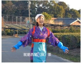
愛知県及び香川県東かがわ市の動画配信の様子