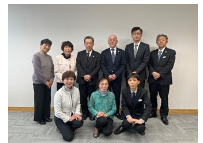
稲垣大使と松本黒潮町長他関係者