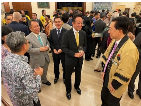
PRレセプション会場の様子