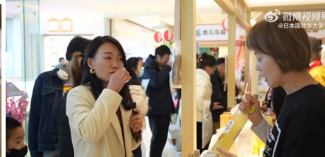
中国で実施されたイベントの長崎県ブースにおける動画配信の様子