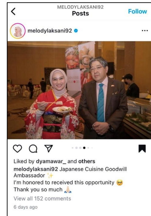
メロディ氏のインスタグラム投稿