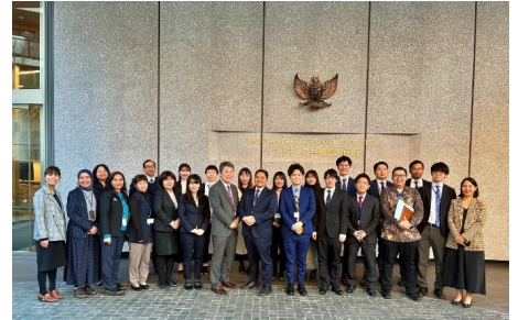
駐日インドネシア大使館前での記念撮影

2月7日、地方自治体から外務省に派遣中の職員が駐日インドネシア大使館を訪問しました。インドネシアの概要、日本との二国間関係のほか、両国の地方との交流等について学ぶことができ、大変有意義な研修となりました。