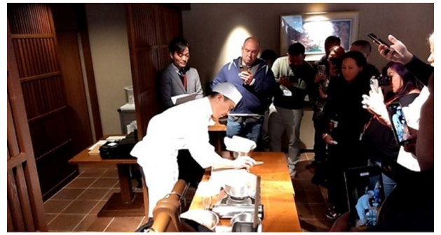
「茅乃舎」の料理長によるだし講座