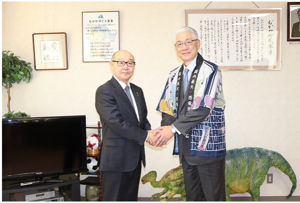
竹中町長と尾崎大使