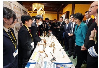
後藤田徳島県知事とともに、高校生によるSDGsの取組紹介ブースを視察する上川大臣

3月13日、上川外務大臣と後藤田徳島県知事の共催レセプションを駐日外交団等を招いて飯倉公館で開催しました。徳島県産の食品・ホスタウン交流、SDGsに関する企業や高校生による取組、観光、伝統工芸品や徳島の伝統的な「阿波おどり」パフォーマンス等の紹介を通じて、徳島県の多様な魅力をPRしました。