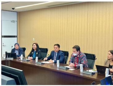
研修生を歓迎する駐日インドネシア大使館職員