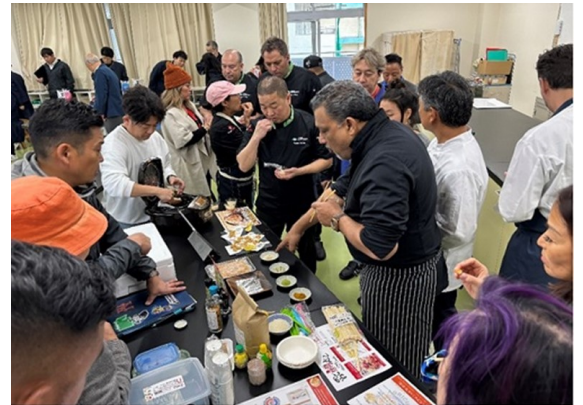
宇和島水産高校における漁業事業者との意見交換