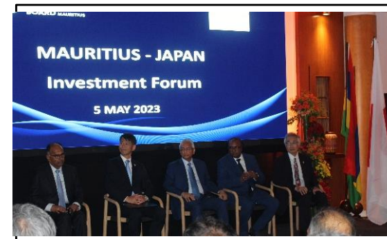
投資促進フォーラムの様子