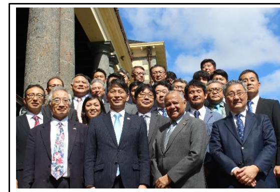
ボワセゾン大統領代行への表敬