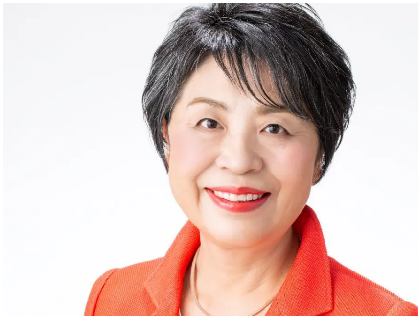
Japans Aussenministerin Yoko Kamikawa.