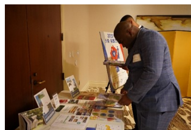
自治体のパンフレットに目を通す来場者

2 月21日、在アトランタ日本国総領事館はジョージア州アトランタ市において「令和4年度天皇誕生日祝賀レセプション」を開催しました。当日は米国南東部の州や市と姉妹都市関係にある日本の6つの自治体の展示ブースを設置し、我が国の地方の魅力をアピールしました。