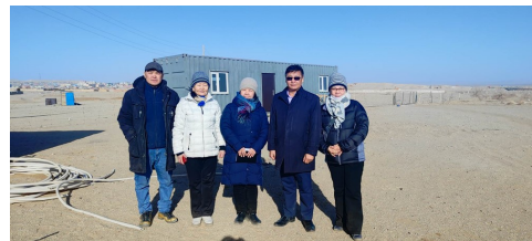
ドルノゴビ県の緑化試験サイトにて、関係者と