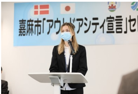
嘉麻市「アウトドアシティ宣言」セレモニー