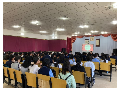
サインヤンド第5番学校の高校生たちとの意見交換