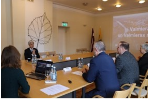
ヴァルミエラ郡議会での意見交換の様子