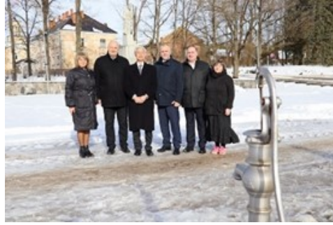
姉妹都市提携調印を記念して 設置されたポンプ前にて