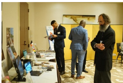
自治体PR動画に熱心に見入る来場者