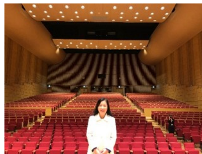
シェルターなまようホールにて

山 形県南陽市はホストタウンとしてバルバドスとの交流を推進してきており、福島在バルバドス日本大使が山形県南陽市を訪問し、来年の日・カリブ交流年2024に向け、意見交換等を行いました。