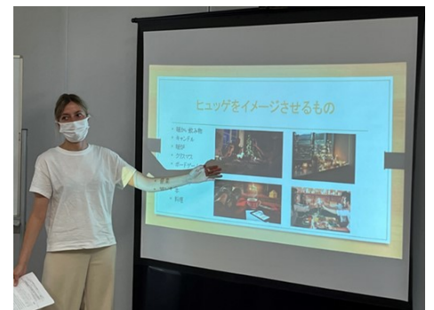
出前講座で講師をしている写真