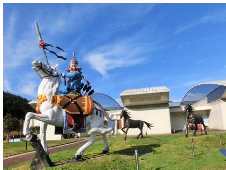
日本・モンゴル民族博物館