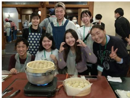
昨年の合宿の様子