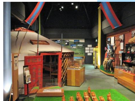
日本・モンゴル民族博物館