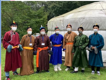
昨年の合宿の様子