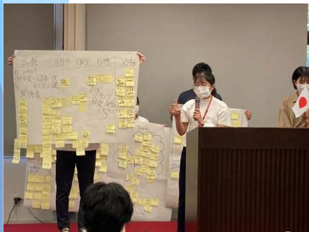
昨年の合宿の様子