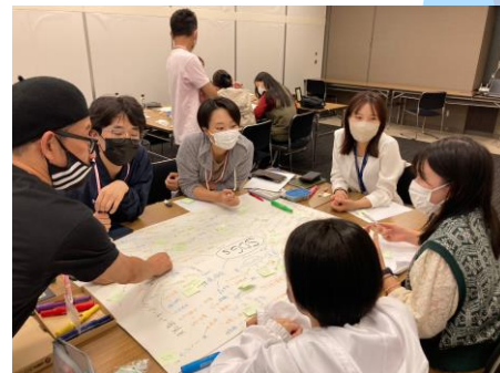
昨年の合宿の様子