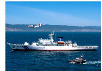
日米合同捜索救助訓練