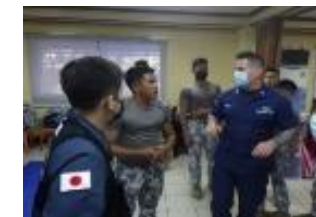
日米連携による能力向上支援