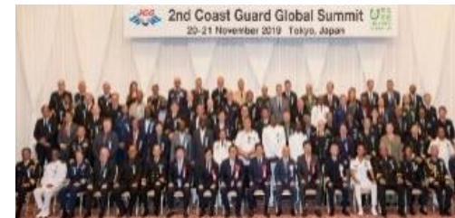
世界海上保安機関長官級会合