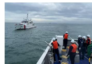
我が国が供与した巡視船への能力向上支援