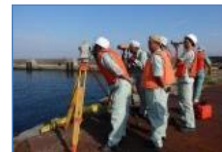
海図作成に係る能力向上支援