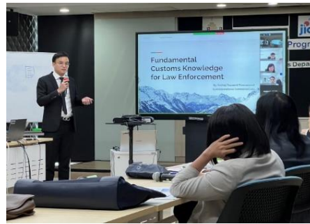
タイ 税関人材育成能力強化プロジェクト