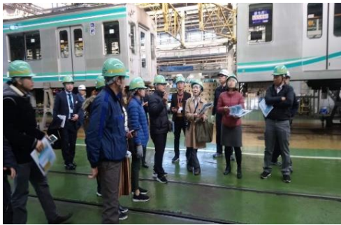
ベトナム 本邦研修(車両保守)