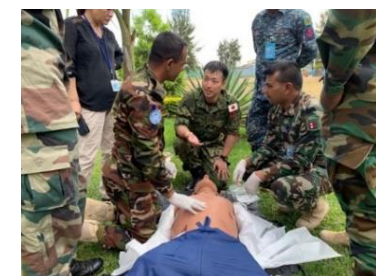
工兵訓練・医療訓練の様子