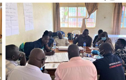
難民の緊急支援・自立支援にかかる計画策定の様子(ウガンダ)