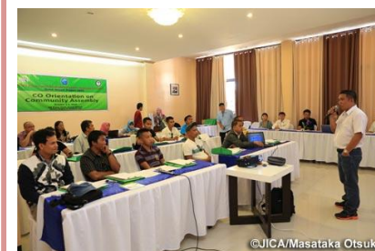
バンサモロ移行委員による平和に向けたオリエンテーション(フィリピン)