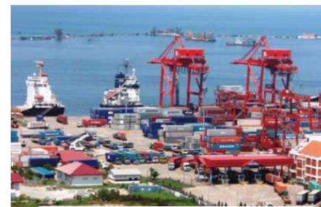
カンボジア・シハヌークビル港