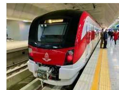
タイ都市鉄道レッドライン