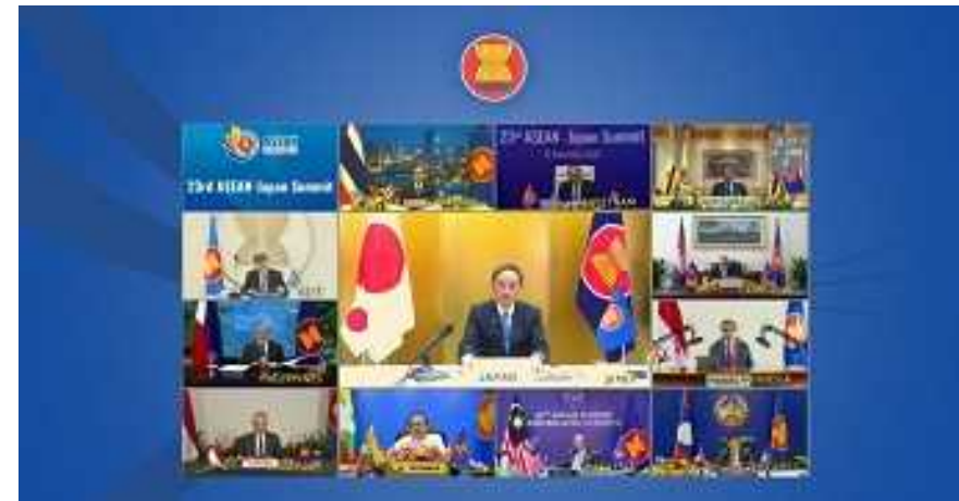
第23回日ASEAN首脳会議(2020年)