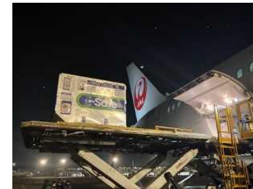
インドネシアへのワクチン供与

1,600万回分のワクチン供与及び「ラスト・ワン・マイル支援」を含む累計約320億円分の無償資金協力。