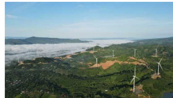
同事業で設置したベトナムの風車12本