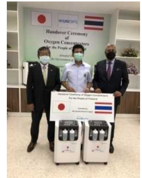
酸素濃縮機の贈与式