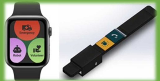
学生が課題解決のために提案したアプリやツール