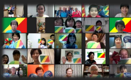
今後も埼玉のホストファミリーが海外選手団 を応援していきます (写真はコンゴ共和国パ ラリンピックチームの壮行会)

2 020年12月の第1回開催から直近第6回開催までで延べ300人超の海外選手団及び関係者と県内ホストファミリーがオンラインで交流。もともとは東京大会で訪日した海外選手団の家族や大会関係者が県内家庭でホームステイを行う予定だったところ、コロナ禍の状況を踏まえオンライン形式へ切り替わり、交流の規模が目下拡大中!ホストファミリーは海外選手団の応援団としてエールを送ると同時に埼玉の観光やグルメなど様々な魅力も発信。メダリストとの交流も行われるなど大いに盛り上がっています!