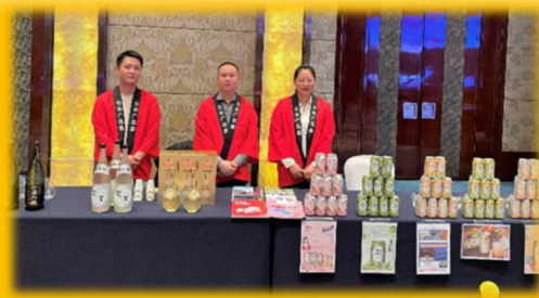
広島事務所による日本酒及びカクテルのPR

2021年3月、中国の在重慶総領事館が重慶市内ホテルで開催した天皇誕生日祝賀レセプション。新型コロナウイルス感染対策のため、約140名という限られた参加人数の中で日本の地方の魅力PRが行われました。同市と友好都市の広島市による日本酒とカクテルのPR、同市江津区と友好都市の宮崎県都城市による焼酎のPR、静岡県の観光PRなど多くのブースが設けられました。早速その様子を見に参りましょう!