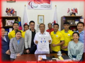
伊勢市児童がラオス選手の ユニフォームカラーをデザイン (2020年2月)