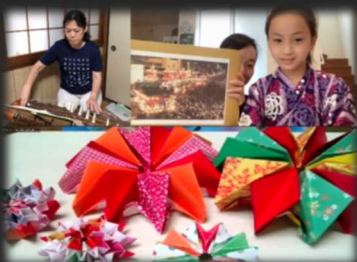
ホストファミリーからは琴演奏、埼玉の祭り紹介、 折り紙の花火の披露などの温かいおもてなし