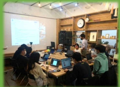
未来技術分野でのオンライン・ワークショップの様子